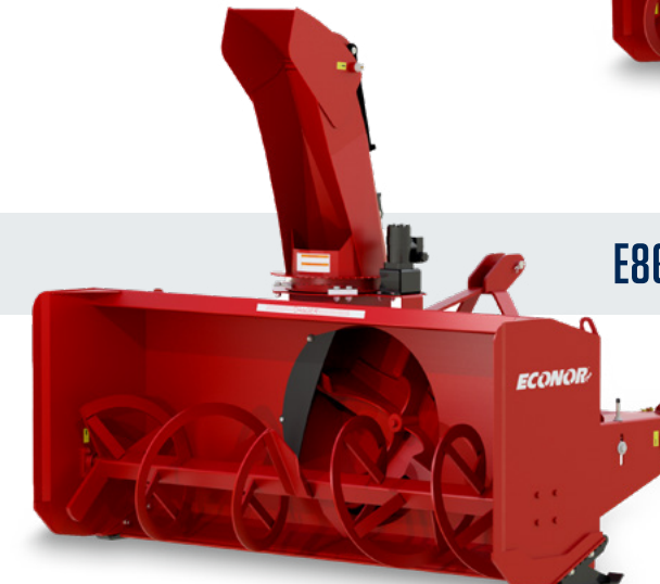
E86-280 PLUS | E94-280 PLUS