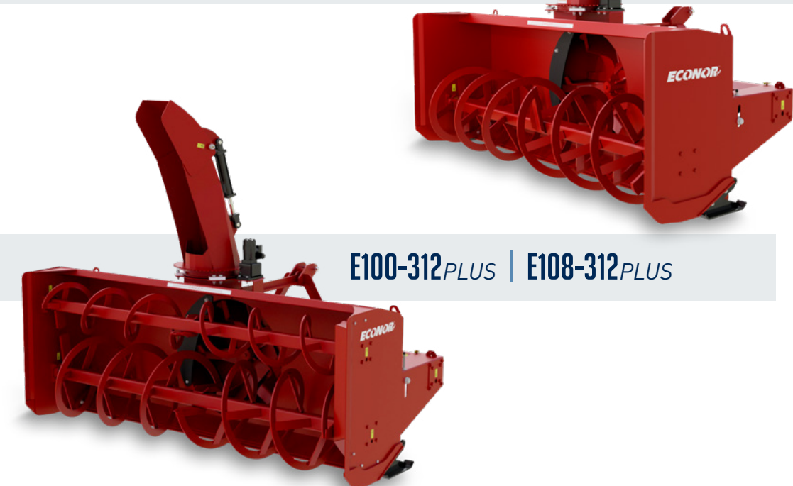
E100-312 PLUS | E108-312 PLUS