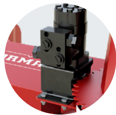
E54-220 PLUS | E60-220 PLUS | E66-220 PLUS

Rotation de la chute par moteur hydraulique (Optionnelle)