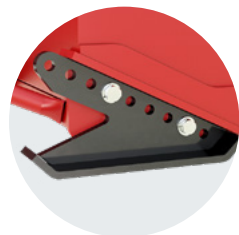
E68-240 HYB | E74-240 HYB

Patins ajustables à angle en acier au carbone