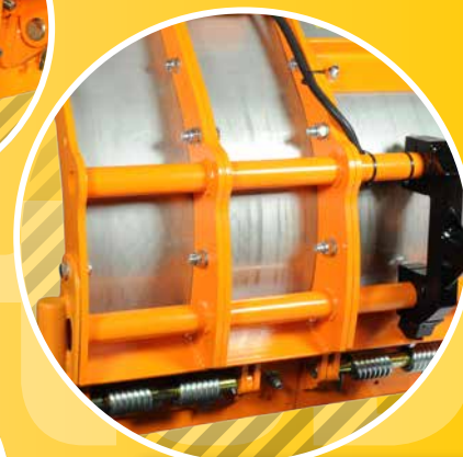
2 SEGMENTBAUWEISE SEGMENT METHOD OF CONSTRUCTION PRINCIPE DE SEGMENT