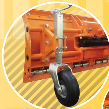
3 LAUFRÄDER CASTERS ROUES DE ROULEMENT